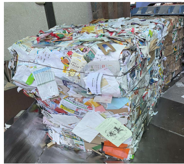
プレス機で固められた古紙